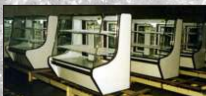
Injeção em balcões frigoríficos