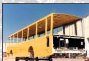
Spray de poliuretano sob teto