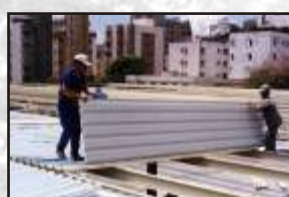
Telha térmica estruturada com poliuretano