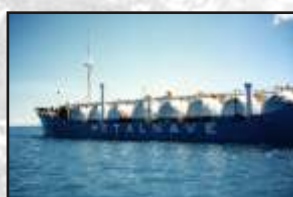
Isolamento térmico na indústria náutica