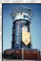
Ar condicionado em shopping-center