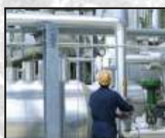
Isolamento térmico em instalações frigoríficas