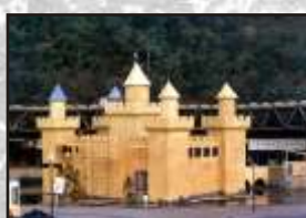
Miolo estrutural em parques temáticos