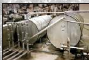
Isolamento térmico em caixa d'água de sistema de coletor solar